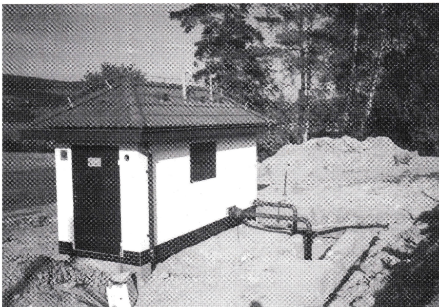
Nová regulační stanice na Kvíčale